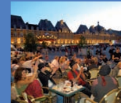
Place Ducale - Charleville-Mézières