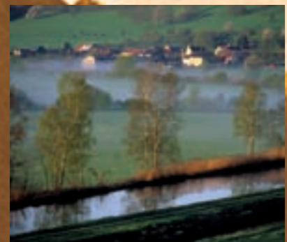
Onicourt - Canal des Ardennes

Pont à Bar, Stenay, Dun sur Meuse, puis retour vers Pont à Bar