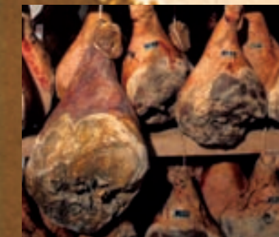
Jambon sec des Ardennes