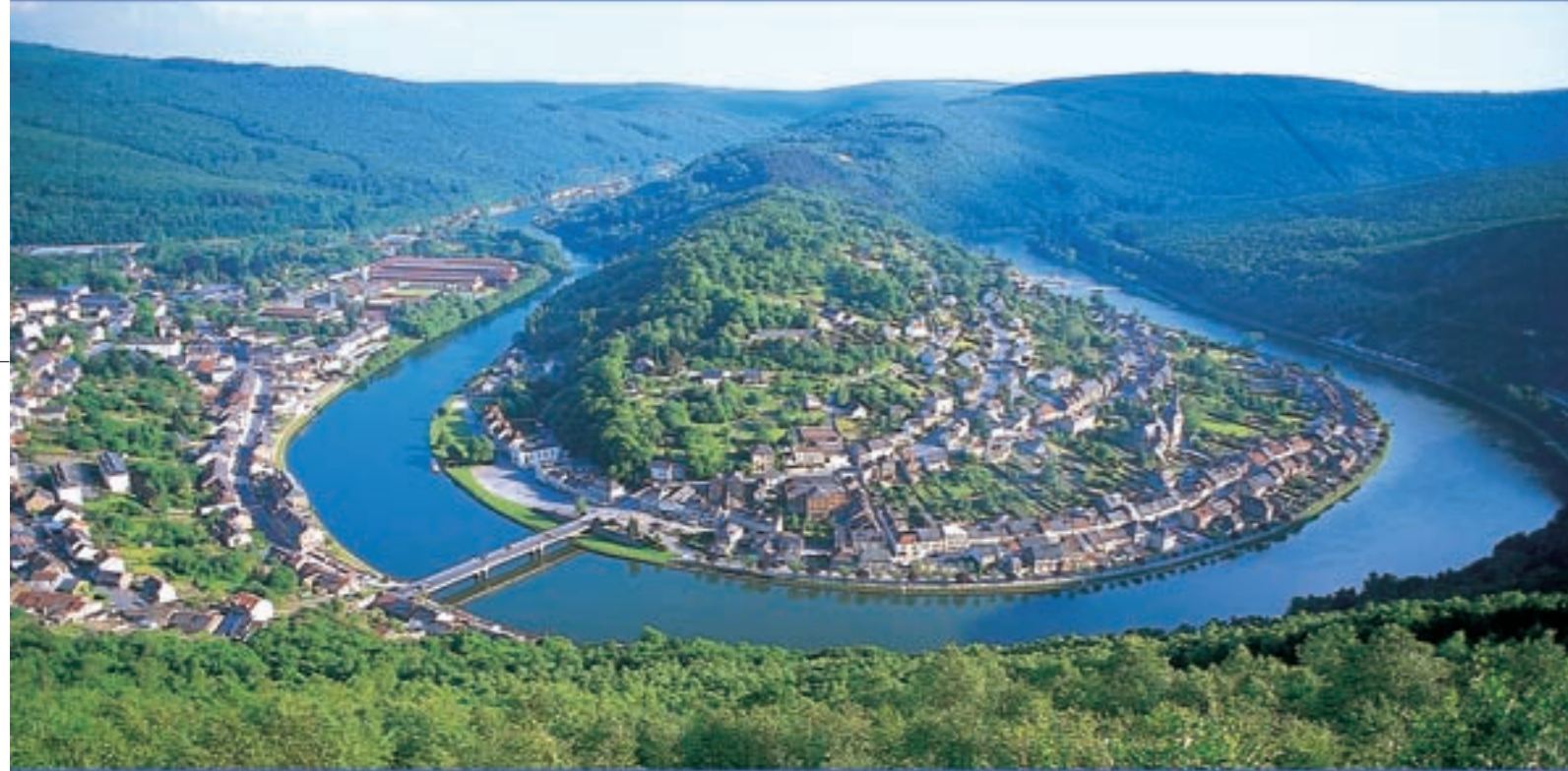
Méandre de Monthermé

Au départ de Pont-A-Bar, nombreuses formules : Week-end (2 jours) Mini-semaine (4 jours en semaine) Semaine (7 jours)