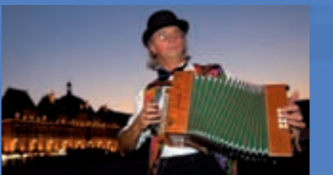
Charleville-Mézières - Festival des Marionnettes