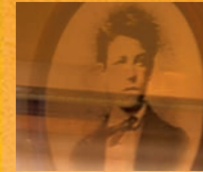
Musée Arthur Rimbaud

Tout au long de votre croisière, vous rencontrerez de nombreux témoins du passé historique et légendaire des Ardennes. Vos escales seront touristiques, gastronomiques ou sportives, vous savourerez les spécialités locales : jambon d'Ardenne, boudin blanc de Rethel, gibier, galette au sucre et bien sûr le Champagne.