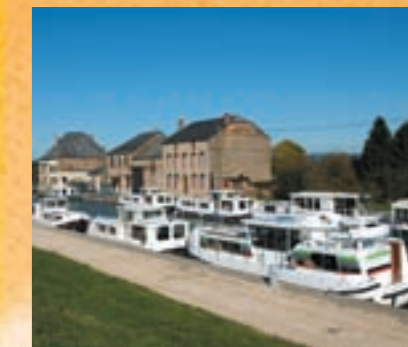
Base Ardennes Nautisme à Pont-à-Bar